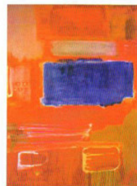
Sopra. Senza titolo , Marc Rothko, 1948. A sinistra. Gondola's off San Giorgio Maggiore , John Singer Sargent, 1902-1903.